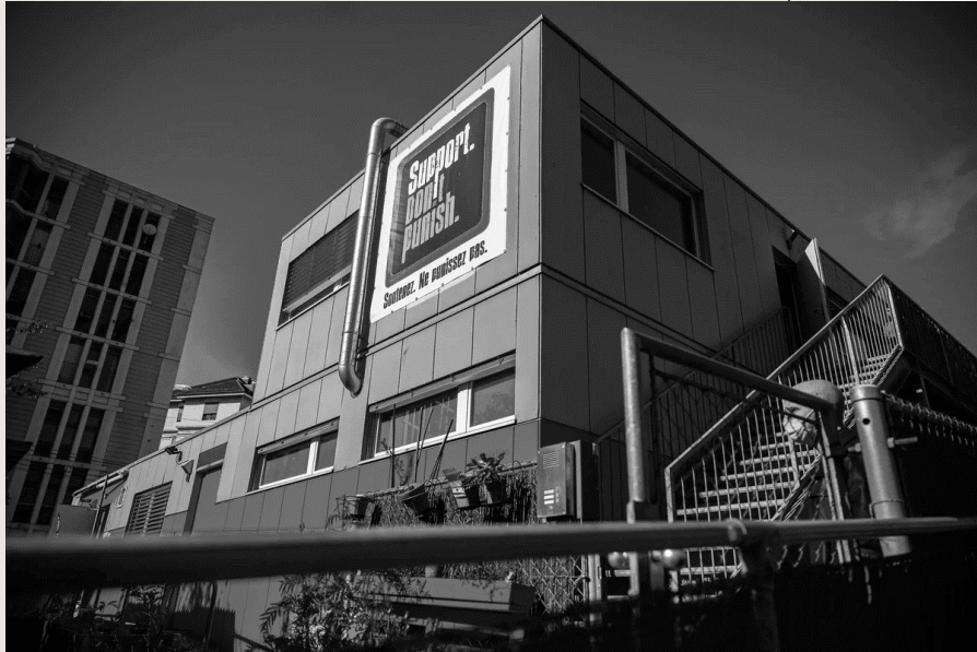
Géré par l'association Première Ligne, l'espace Quai 9 est situé à proximité de la Gare Cornavin