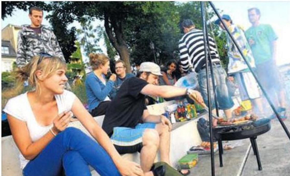
Feuer frei: Vergangenen Sommer lockte das neugestaltete Rheinufer viele Grillfreunde ans Wasser.

Die Anwohner des Rheinufer haben nach den ersten Sommerabenden schon genug vom Lärm und Gestank der Grillmeile. Ein Vorstoss im Grossen Rat fordert die Regierung dazu auf, Massnahmen zu ergreifen – und die Behörden denken über einzelne Grillzonen nach.